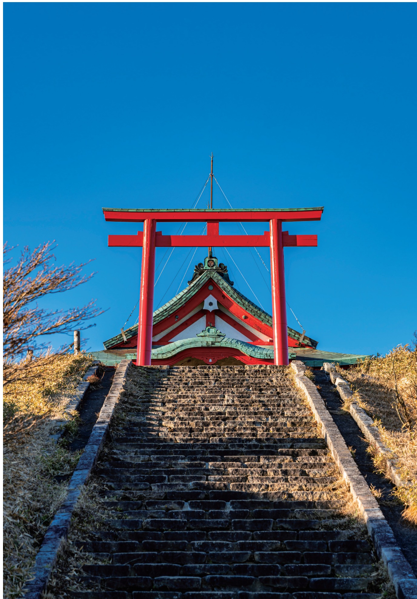
撮影場所：箱根駒ヶ岳 箱根元宮（神奈川県足柄下郡）