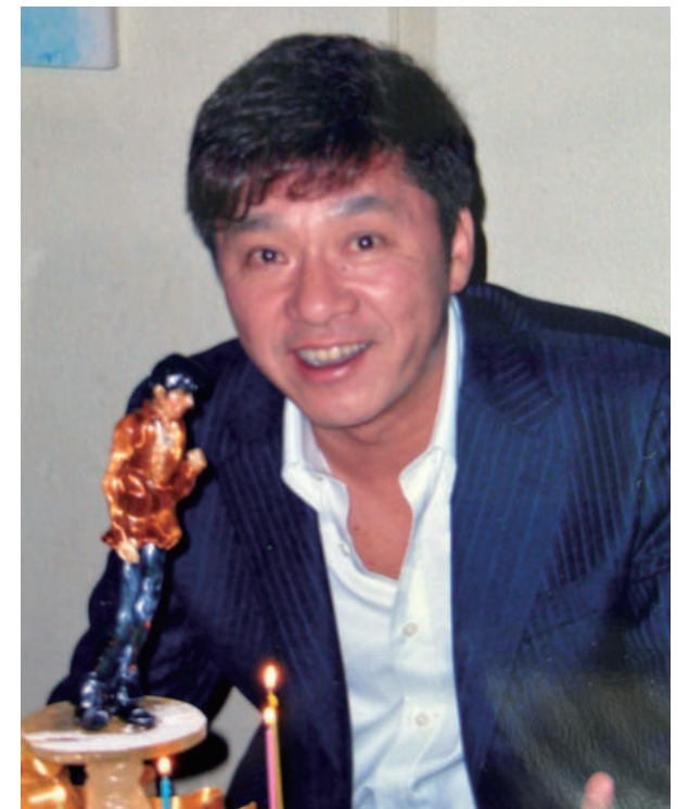
友人のお店にてお誕生日会。秀樹さんを模した飴細工に感激していました。

今年一年、無事に過ごせたことに感謝しながら、新しい一年も免疫力が上がってお風邪もひかず、健やかな大腸、健やかな人生となりますよう心よりお祈り申し上げます。