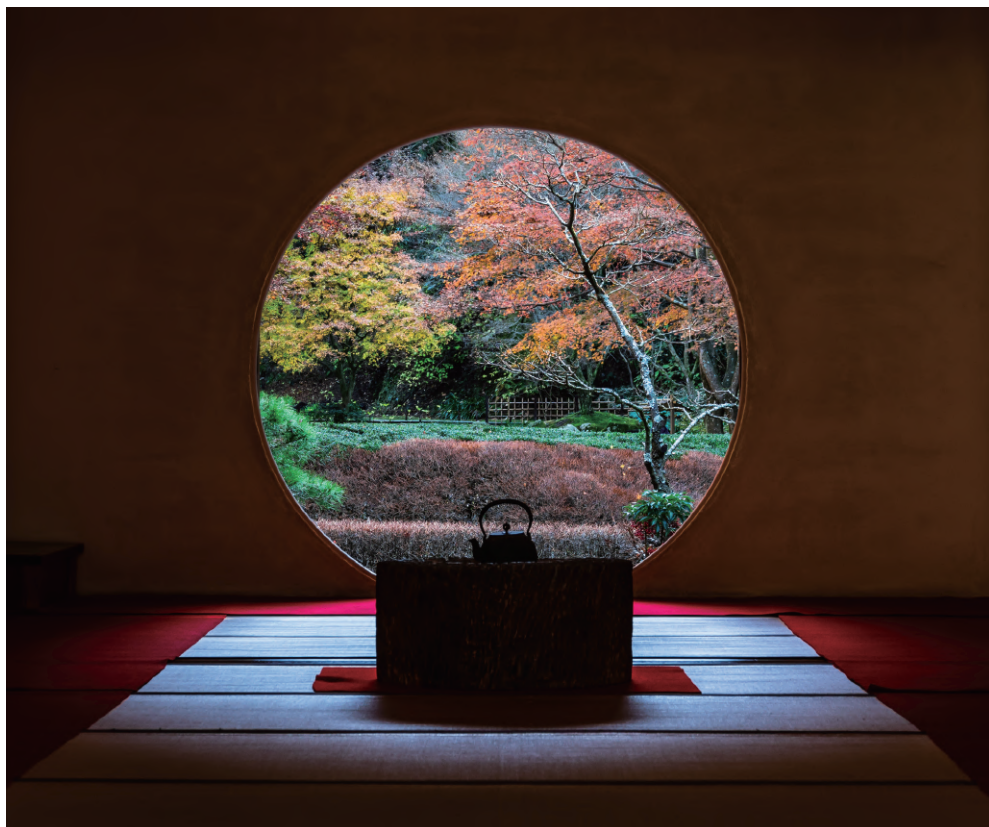
悟りの窓／明月院（神奈川県）