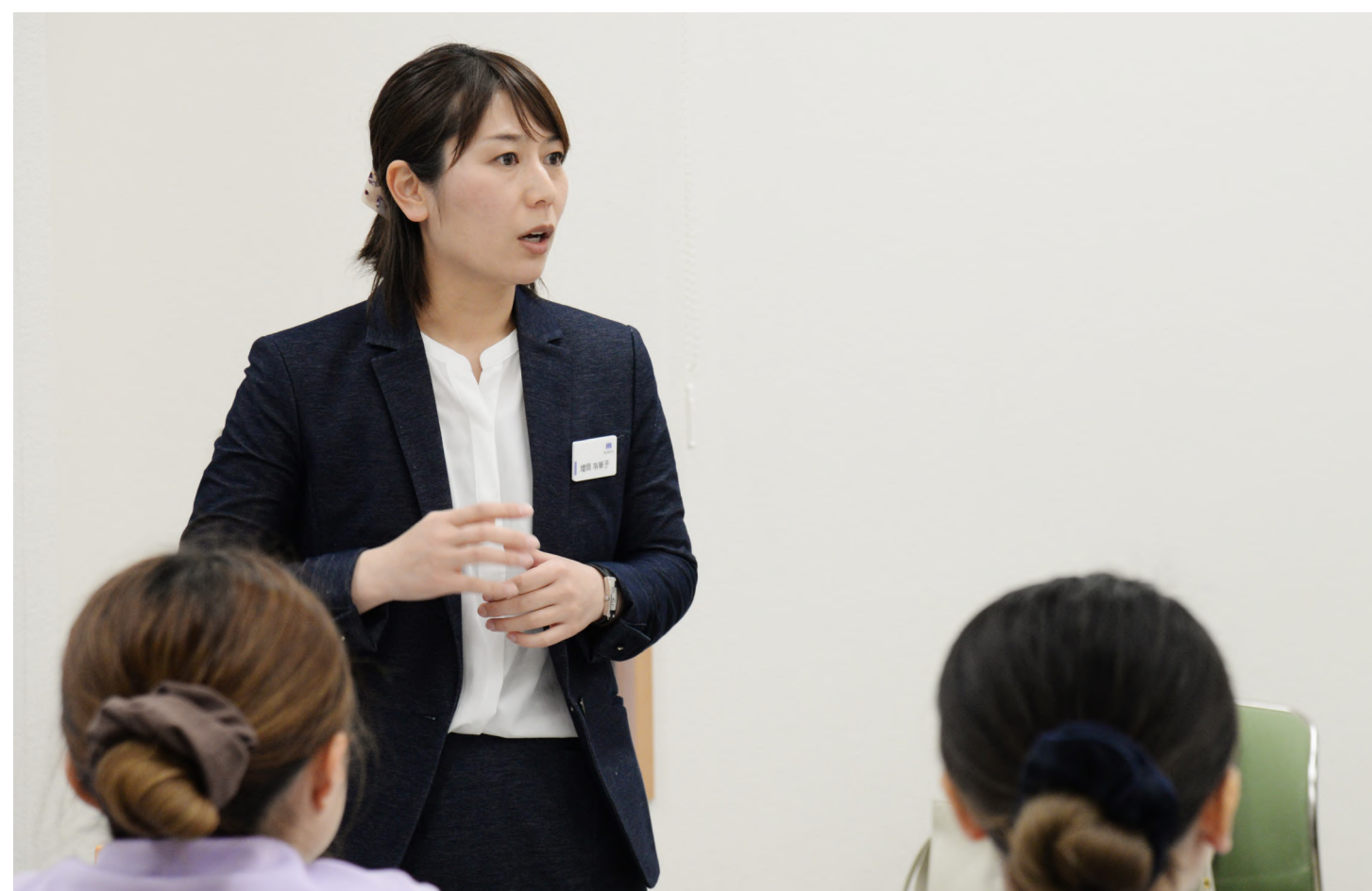
株式会社ライオンによるレクチャー