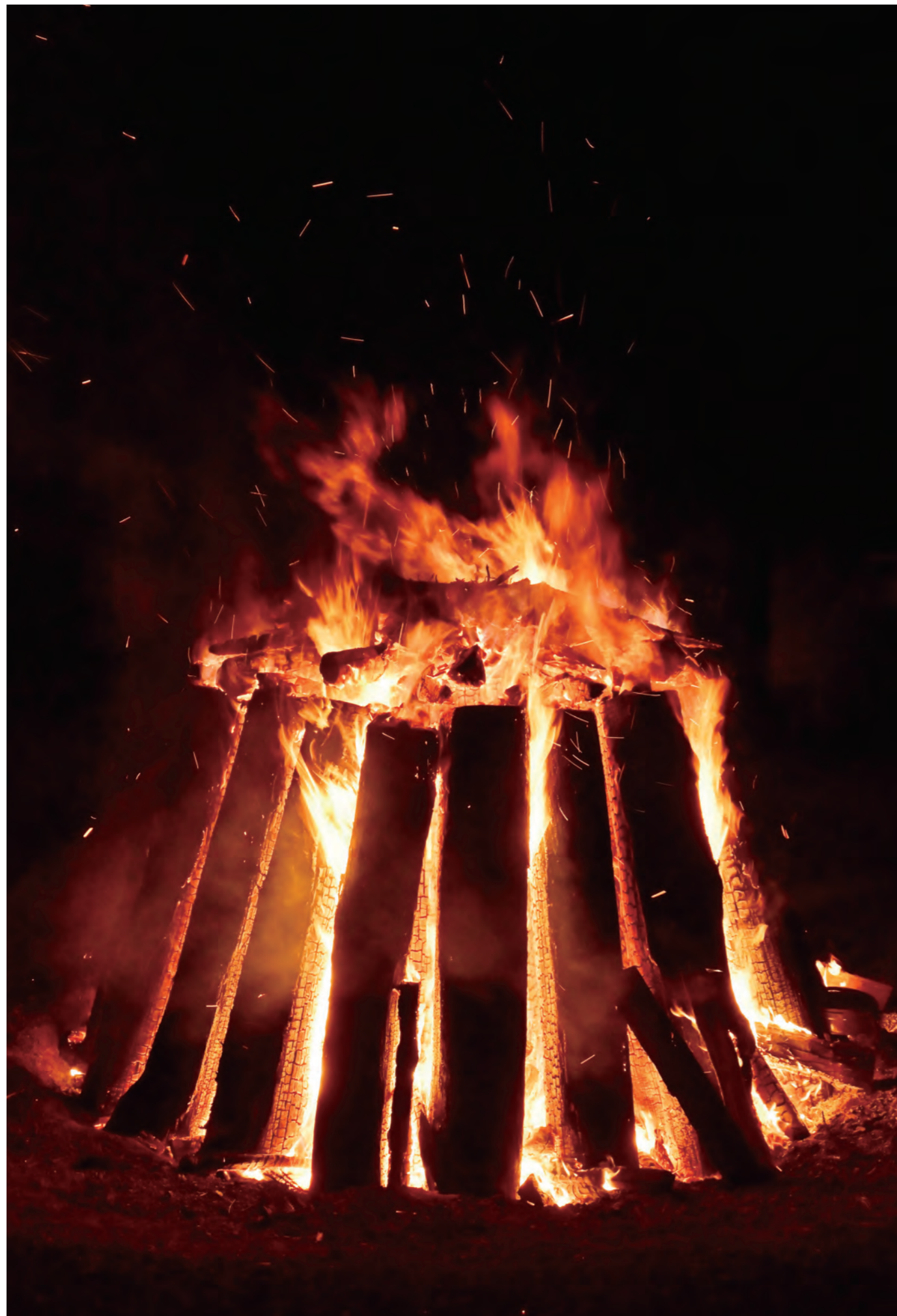
撮影場所：伊勢神宮 どんど火（三重県伊勢市）