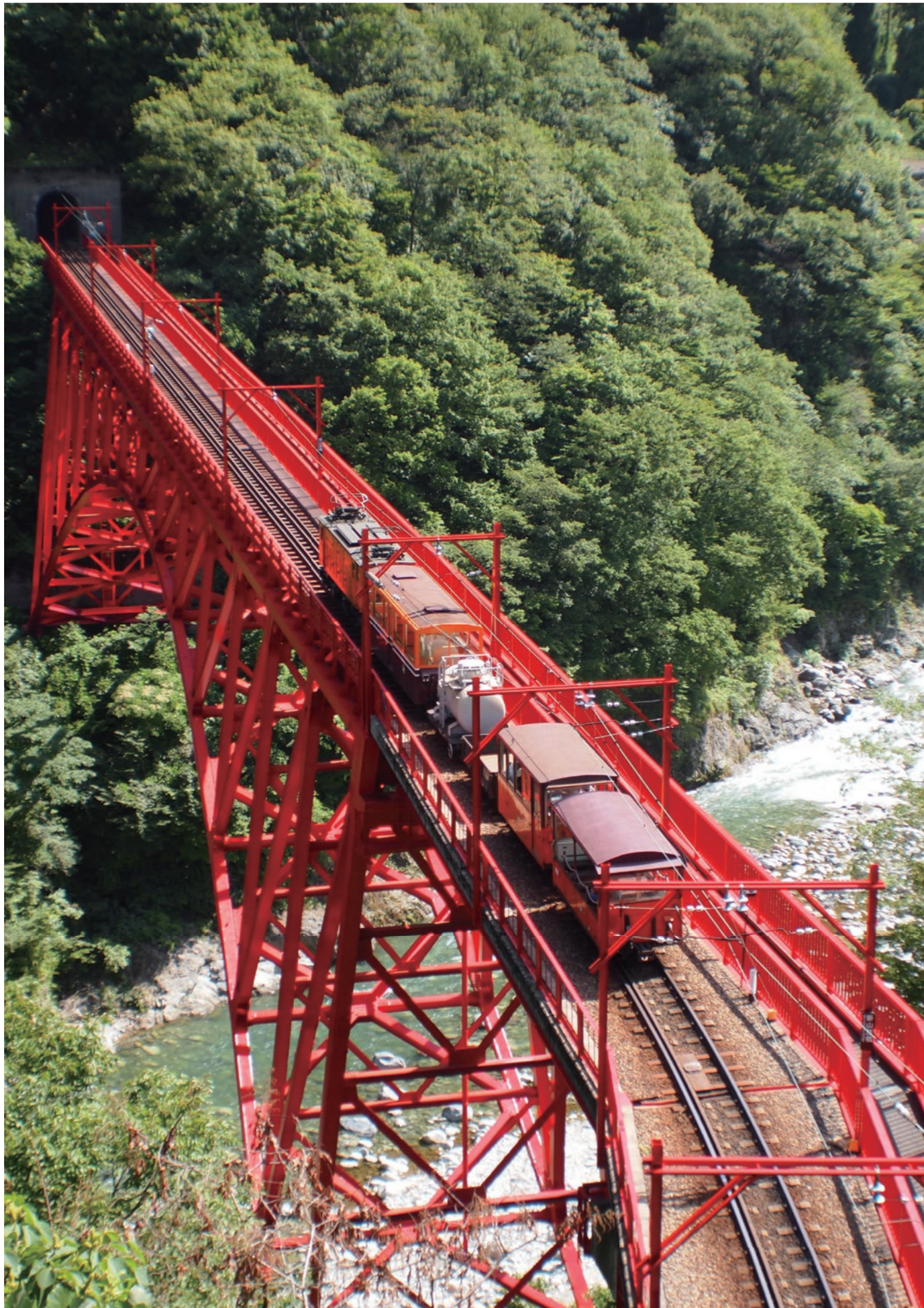
撮影場所：富山県黒部市

今から15年程前の事になりますが、銀座に「ギルビーA」というバーがあり、そこに当時101歳の現役のオーナーママさんがおられ、話題になった事が有りました。