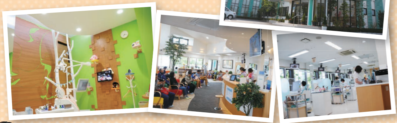
※歯科医師6名、歯科衛生士6名、歯科助手9名、歯科受付7名で対応しております。

http://www.tokushinkai.or.jp/clinic/aoba/