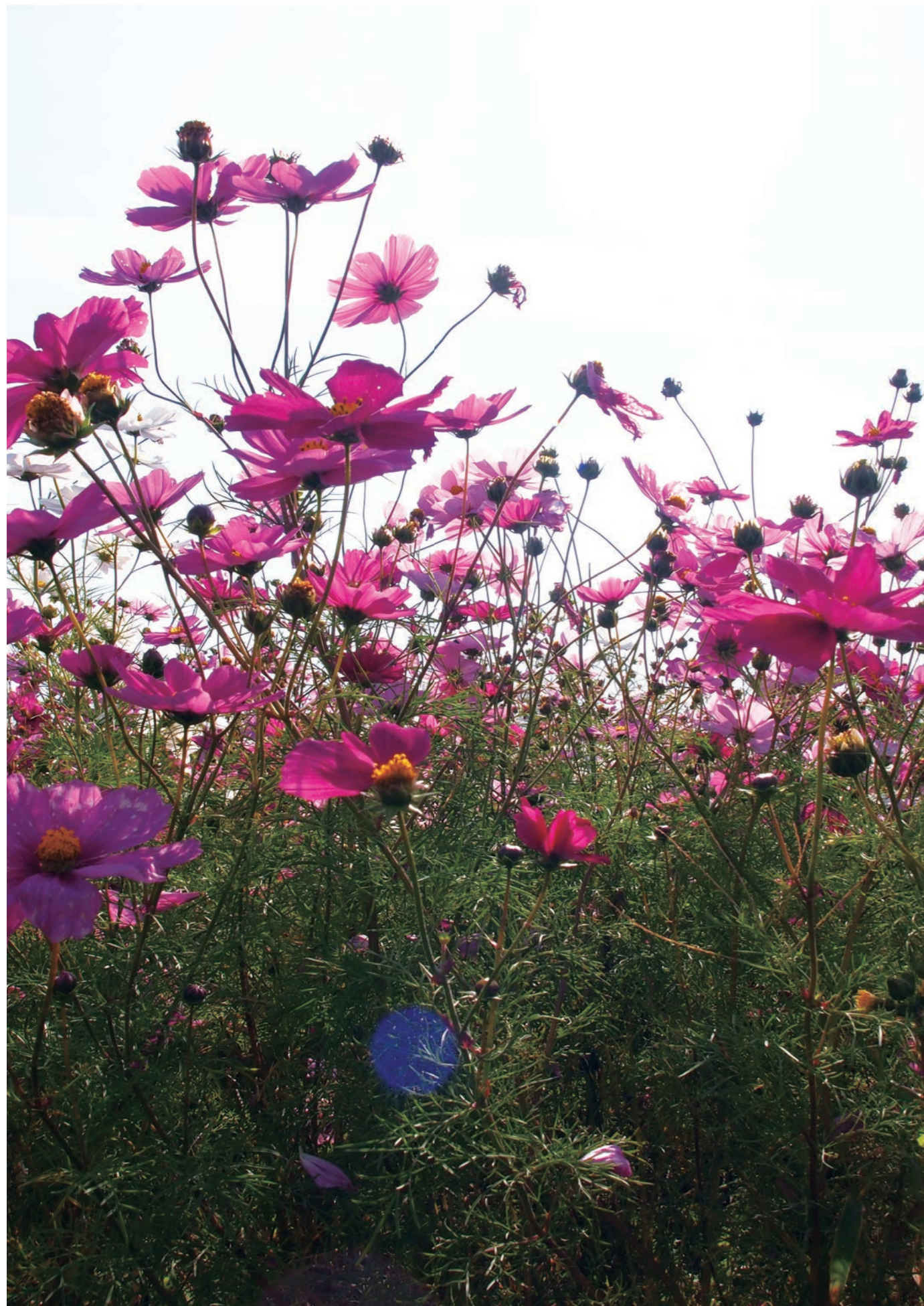
撮影場所：新潟県新潟市