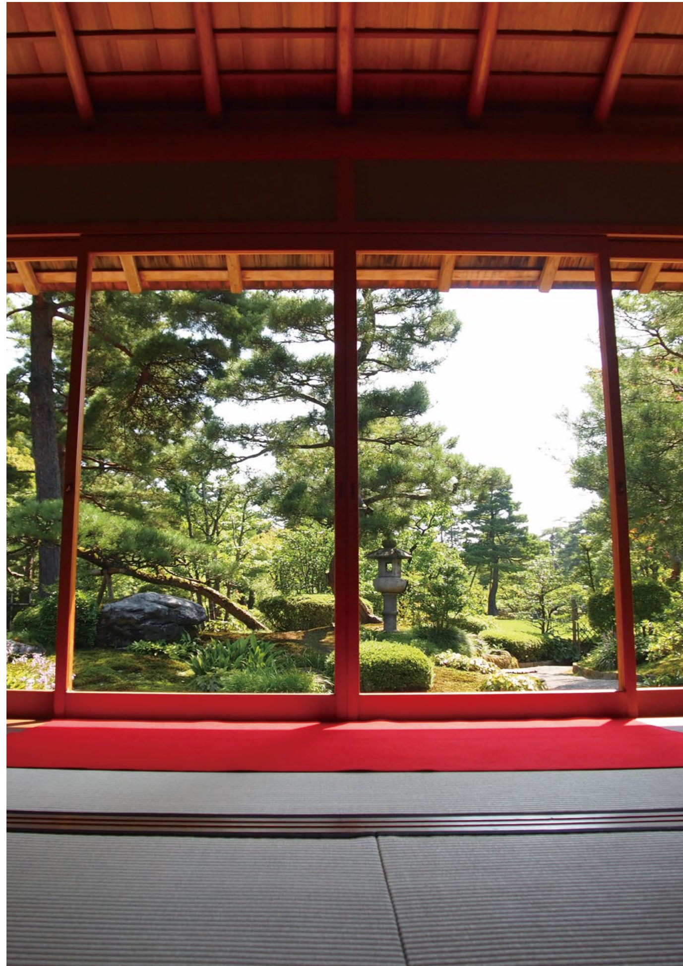
撮影場所：兼六園(石川県金沢市)