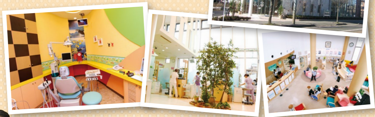
※歯科医師6名、歯科衛生士8名、歯科助手9名、歯科受付6名で対応しております。

http://www.tokushinkai.or.jp/clinic/niitsu/