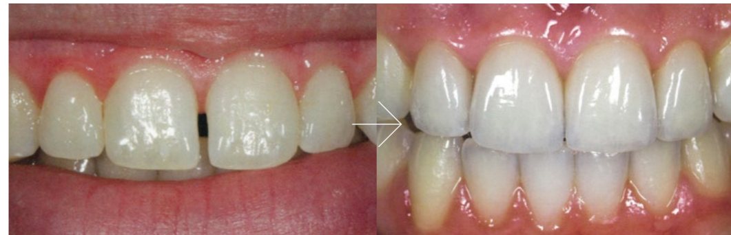
↑ Before・・・形がいびつで隙間のあった前歯2本。 ↑ After・・・マイスターによって手作りで製作された歯を装着。全く違和感なく周りの歯とマッチしている。

Ultimate Styles で製作された「歯」を実際に装着した写真です。限りなく「本物」に近い、始めから生えていたかのような、自然で美しい歯科技工物を提供いたします。