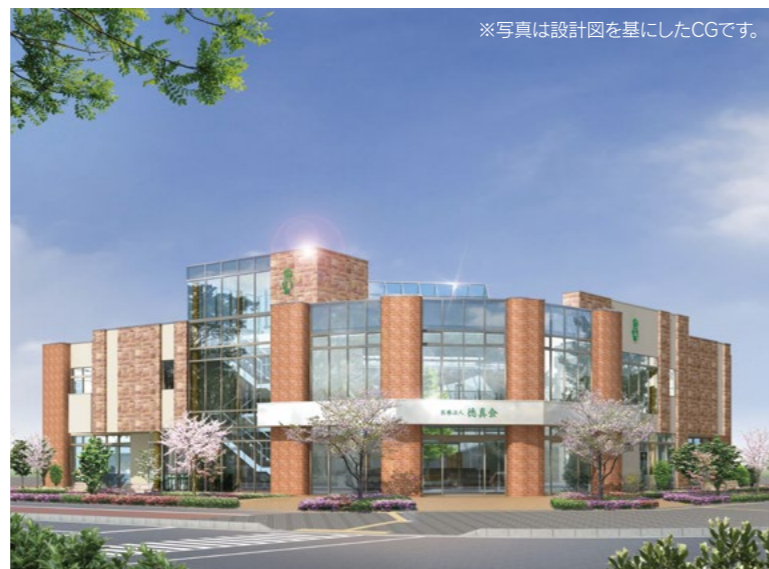
※写真は設計図を基にしたCGです。

○徳真会グループでは、今後も新しい診療所をオープンしていきます。どうぞご期待ください。