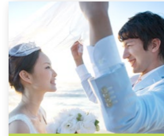
ブライダルホワイトニング