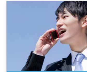
メンズホワイトニング