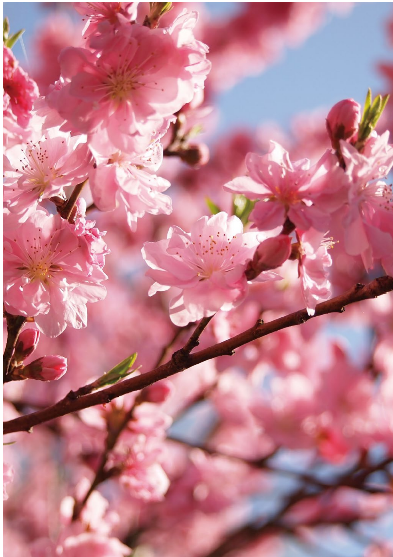
撮影場所：彌彦神社（新潟県西蒲原郡弥彦村）