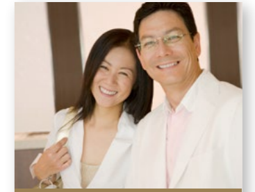
熟年の方向けホワイトニング