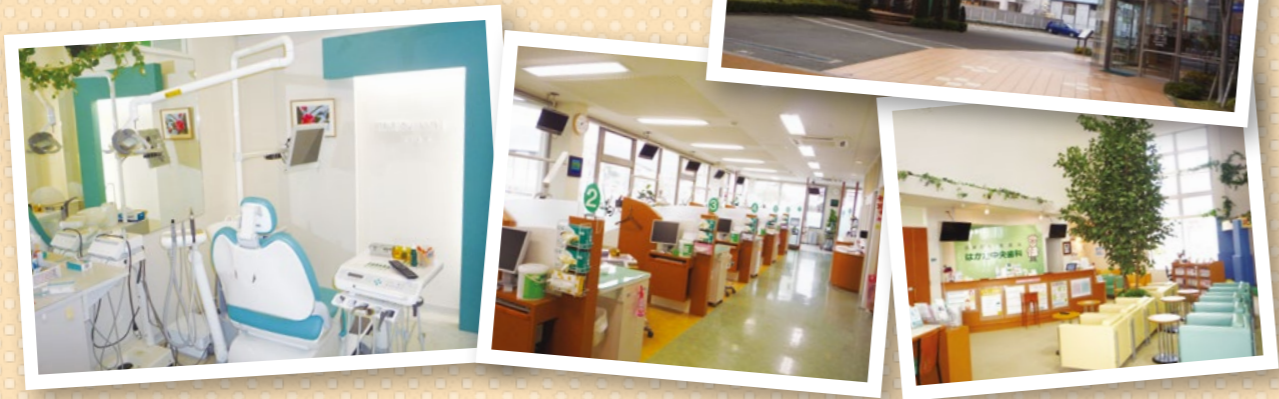
※歯科医師3名、歯科衛生士3名、歯科助手6名、歯科受付3名で対応しております。

http://www.tokushinkai.or.jp/clinic/hakata/