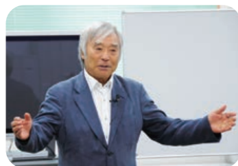
◆ミウラドルフィンズホームページ www.snowdolphins.com

2010.10.7 | 講師: プロスキーヤー 冒険家 三浦 雄一郎氏 国家観養成講座 Global Skill 青葉第二歯科 PML 日蔭 陽子