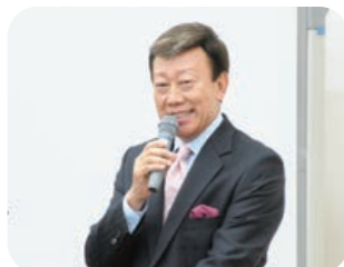
◆橋幸夫氏ホームページ www.pyramid-mu.co.jp

「人生観」のお話の中で、「縁」の大切さ(出会い、触れ合い、めぐり合い)を教えてくださいました。そして、さまざまな体験が日々の勉強・学びに結びつく事を、実体験を交えてお話下さいました。生きる意味、仕事をする意味、人との関わりを深く考えさせられる貴重な時間となりました。