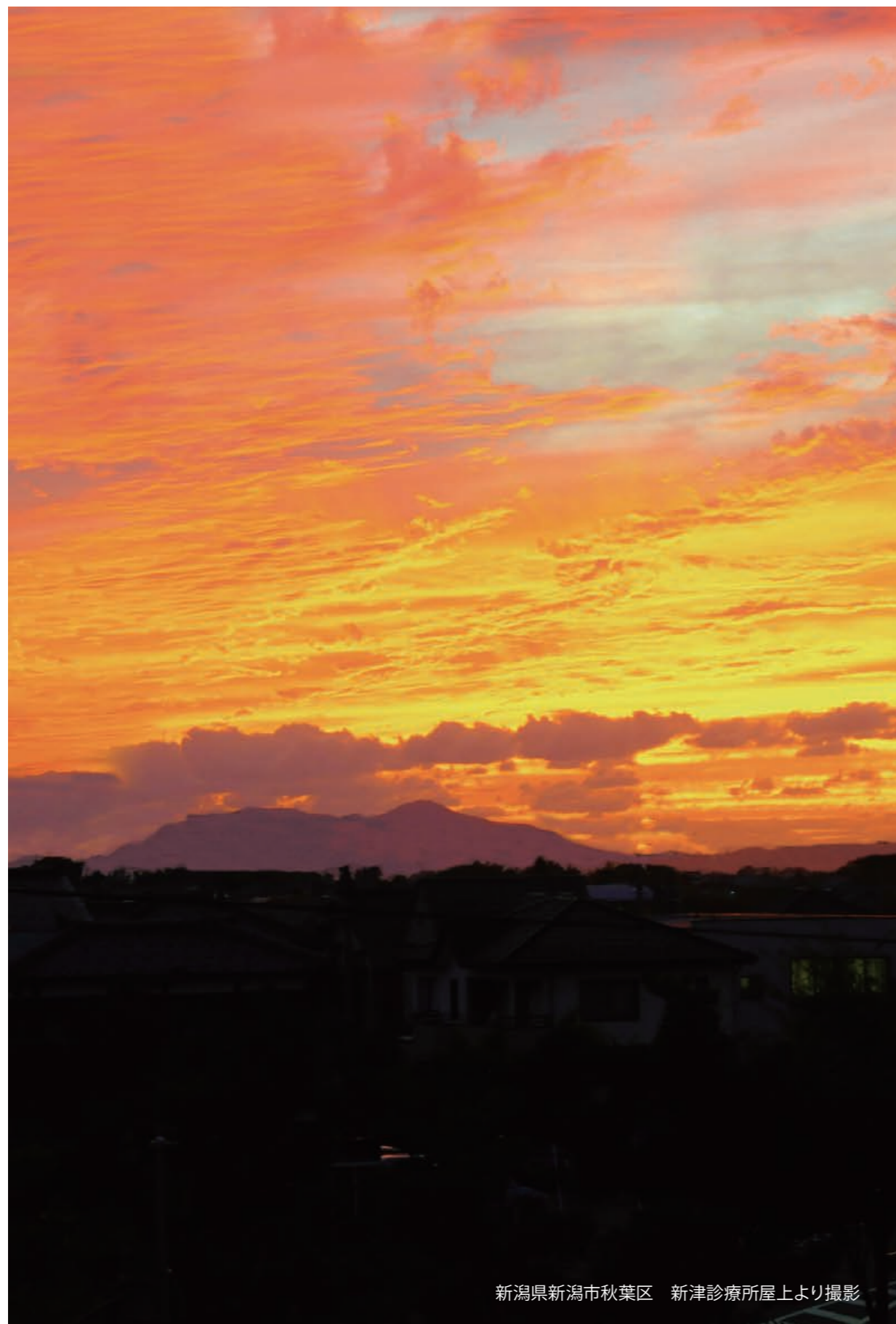
新潟県新潟市秋葉区 新津診療所屋上より撮影

中国北宋代の蘇東馳(1036~1101)は、 そとうば 旁不忿(「かたはら痛い」の意)の事として次の項目を上げています。