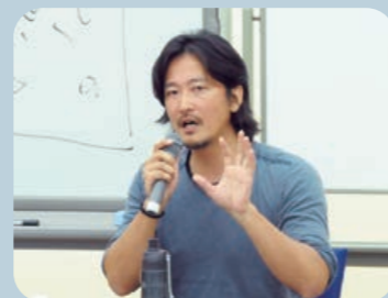
◆紀里谷和明氏ホームページ www.kiriyama.com

「人とコミュニケーションがとれない人間は、良いものは作れない」とお話頂き、生きていくうえで人とのコミュニケーションは不可欠なものだと強く感じる事ができました。同じものづくりの仕事をしている私も、アイデアや発想を大事にしていけるよう日々心がけていきたいと思えます。